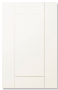
Lina , spårfräst med lätt profilerad kant