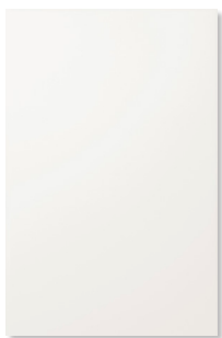
Minna , slät med fasett-slipad kant